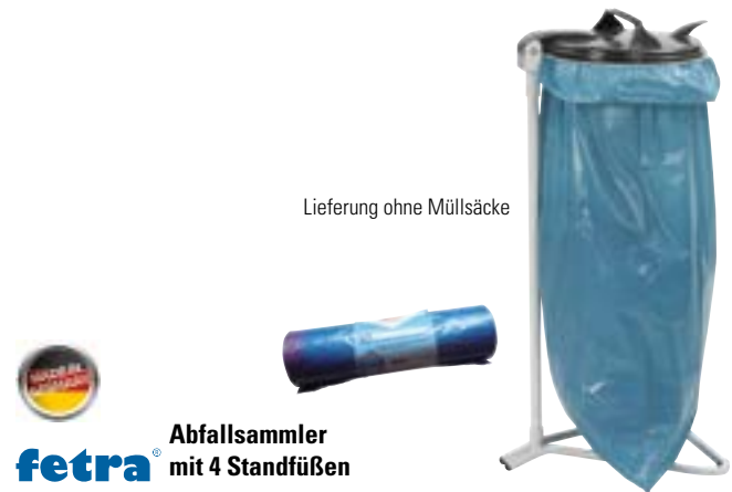
Lieferung ohne Müllsäcke